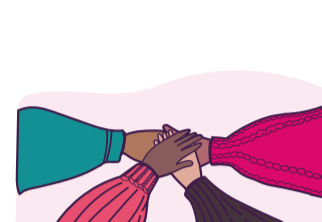
4. Organización comunitaria.