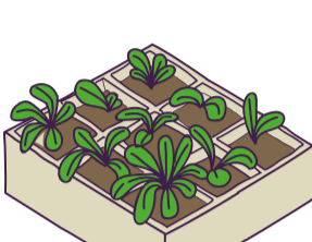
1. Siembra para el autoconsumo

Las estrategias de las mujeres para enfrentar las dificultades de acceso de alimentos durante la pandemia se enfocaron en: