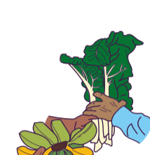
2. Intercambio y trueque de productos