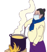
3. Organización de las ollas comunes