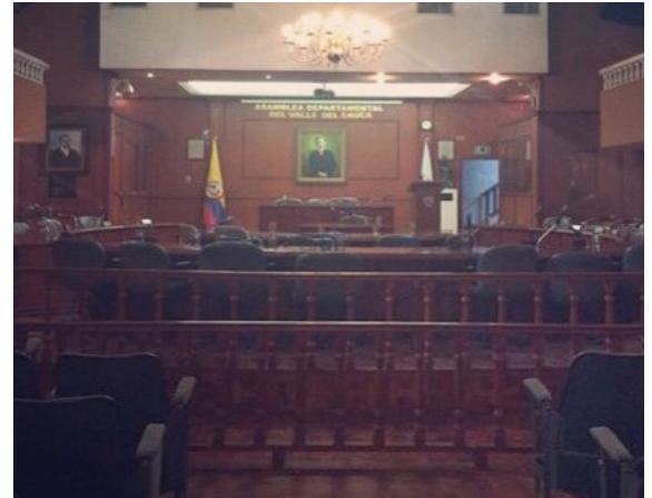
Asamblea Departamental del Valle. Octubre—Noviembre 2014.