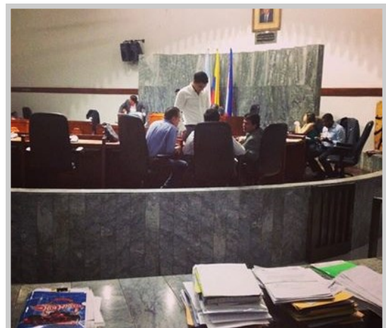
Sesión Plenaria. Concejo Municipal de Santiago de Cali. Octubre- Noviembre 2014

La aplicación del reglamento interno en el Concejo Municipal es frágil en temas de orden y compostura de los concejales. Es común verlos utilizando palabras indebidas e irrespetando las intervenciones de los demás miembros de la corporación o de los secretarios de la administración. El llamado a lista, responsabilidad del Secretario del Concejo, se ha caracterizado por realizarse espaciadamente o establecer recesos de quince minutos para dar tiempo a la conformación del quórum; incluso hay ocasiones donde las comisiones empiezan treinta minutos después de lo establecido en el Reglamento restándole dinámica y tiempo a los invitados o citados e impidiendo que las sesiones sean más efectivas: deliberativas y propositivas ( Estos son los artículos del reglamento interno que comúnmente se incumplen: 57, 72, y 77 )