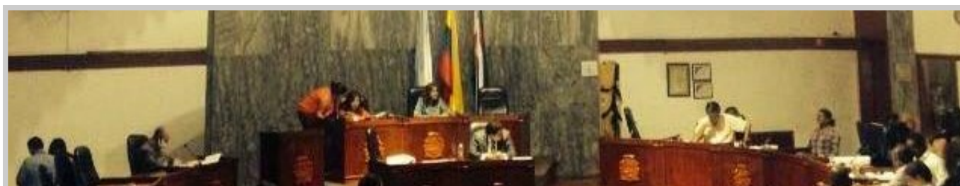
Concejo Municipal de Santiago de Cali Sesión de Control Político

Durante octubre y noviembre, el Concejo de Santiago de Cali tramitó doce proyectos de acuerdo, de los cuales cinco fueron aprobados. El 83% fue iniciativa del Alcalde Rodrigo Guerrero y estuvo, en su mayoría, enfocado en la Gestión Financiera del Municipio; tramitándose en la Comisión de Presupuesto. También se estudiaron proyectos relacionados con Perspectiva de Ciudad : la “Política Pública de Atención a la Discapacidad” y el “Programa del Mínimo Vital de Agua Potable”. Ambos analizados en la Comisión de Plan y Tierras. El primero de ellos aprobado en primer debate, el segundo, convertido en el acuerdo 370.