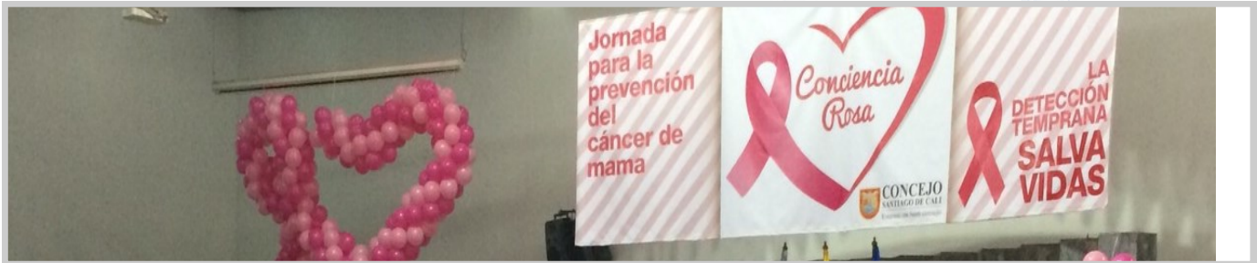
Sesión de Control Político a Secretario de Salud Municipal. Concejo Municipal de Cali.